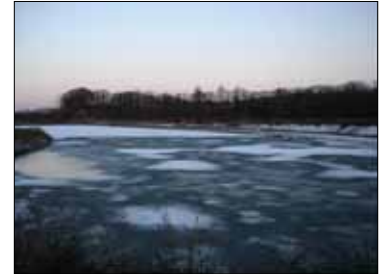
実証試験の候補地点(網走川):津別町付近

構造体の強度や耐久性に関するデータ調査および実証実験箇所の魚類調査・植生調査などにより、基礎データを収集・解析を行なうことも計画している。各担当グループ別に準備中である。第1回プロジェクト会議では、上流からの土砂の堆積などに関する課題、安価に工事を行なう工夫、型枠の形状など新たな課題などが指摘され、その対応についての検討を進めている。