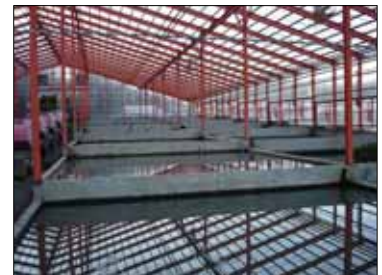
水生植物の栽培用ハウス(冬場のため生産していない)