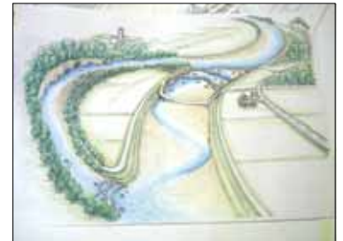
網走川での実証試験のイラスト

マングローブが南国の植物であることは広く知られている。北海道の企業が「マングローブ式」と事業に命名することにより、世間からの注目も集まり画期的な工法と